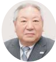
第2780地区 ガバナー 佐々木 辰郎